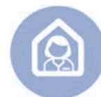
Aide à domicile